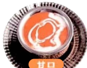
バターチキン Butter chicken