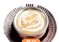
イカマッシュルーム Squid mushroom