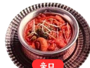
ベジタブルカレー Vegetable