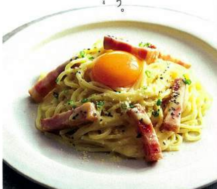
※ 厚切りベーコンのカルボナーラ 580円(+税)

生パスタの魅力をお楽しみください。 当店のこだわりを生パスタ、野菜、肉、魚、 卵、チーズ、トマト、オリーブオイル、 特に入念にこだわったソースは、 ぜひお楽しみください。