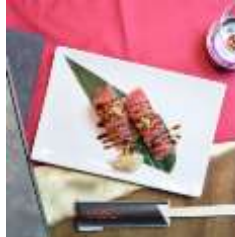
YAKINIKU TORAJI PARAM 「サーロイン握り 2 貫」