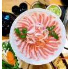
遊食菜彩 いちにいさん 「黒豚のしゃぶ肉の合盛 2 種」