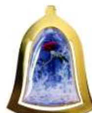
オリジナルブックマーク