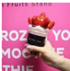
KAJITSU_CLUB 「ストロベリースムージーサンデー」

カレッタ汐留館内の 30 店舗では、思わず写真を撮りたくなるフォトジェニックなフード・ドリンク・グッズをご用意しました。イルミネーションを観た後に、お食事やお買物をお楽しみいただけます。 (一部紹介)