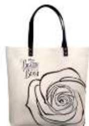
オリジナルトートバッグ