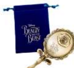
オリジナルミラー