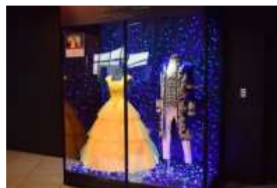
スペシャル衣装展示