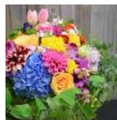
フロリアル 花門 「ポッピング シャワー ブーケ」