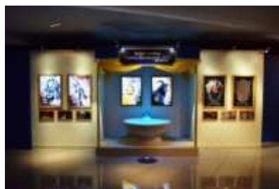
体験型パネル展示