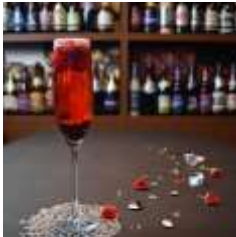
GLASS DANCE 「RBB」