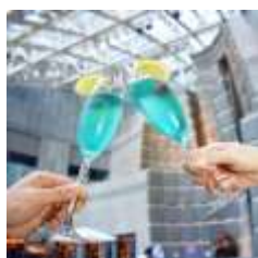
ジャックポット 汐留 「シャンパーニュブルース “愛の饗宴”」