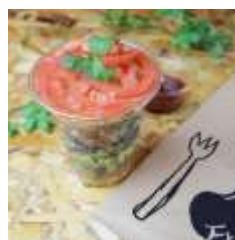
フリーホーレス 「チキンのセビーチェ」